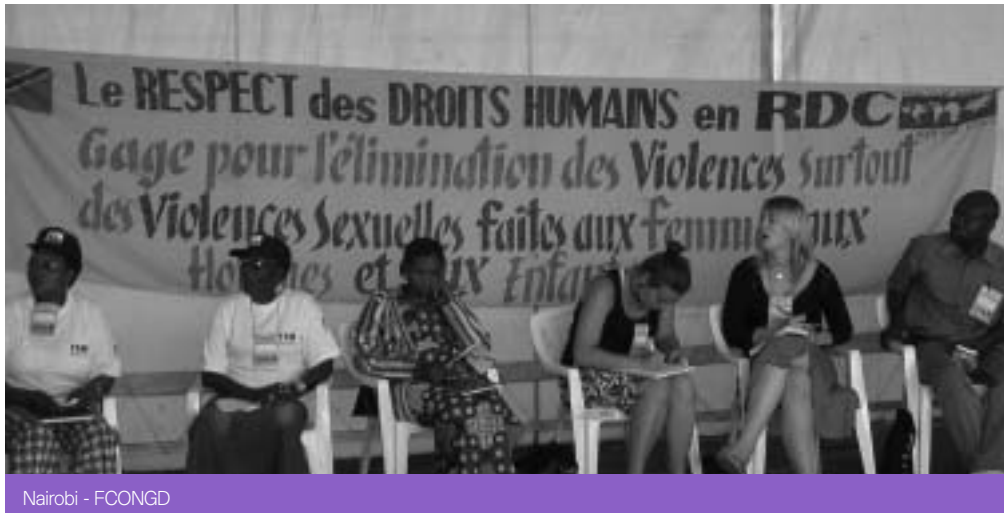
Nairobi - FCONGD

sigui menys fiable o simplement invàlid" (en Cirillo, 2005: 43).