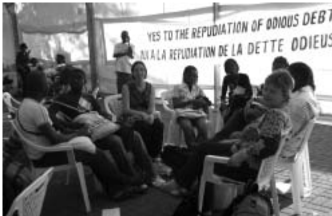
Nairobi, Espai de treball sobre Deute - FCONGD

Els processos generitzants no són quelcom aliè o que se'ns imposi a les persones que integrem les organitzacions, ja que els protagonitzem nosaltres, atès que es tracta del que fem les persones, què diem i com pensem sobre el que fem. La construcció –o desconstrucció– quotidiana del règim de gènere en una organització no es produeix en un plànol ideal, sinó que s'exerceix i manifesta en les nostres actuacions.