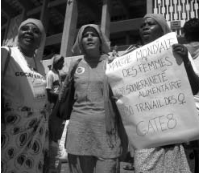
Nairobi - FCONGD