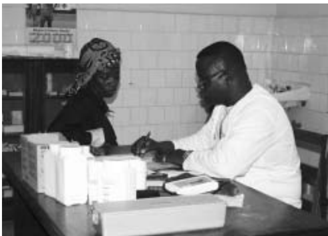
Saint Joseph's Catholic Hospital de Monròvia - Campaña La Salud en el Milenio

La majoria dels hospitals són religiosos o estan en mans d'ONG internacionals. Durant la guerra, l'hospital de referència del Govern va ser tancat, i l'únic que va seguir funcionant va ser l' Hospital Catòlic a Monròvia, que va passar a ser l'hospital de referència nacional. Totes les clíniques i hospitals, si tenien casos complicats, ens els enviaven a l' Hospital Catòlic . El nou Govern ha començat a obrir hospitals, un d'aquests és el de Monròvia, un hospital públic amb 600 llits i que vol ser el nou hospital de referència del país. A més, està obrint hospitals que van ser destruïts durant la guerra a les províncies, per poder començar a tractar la gent a la resta de zones del país.