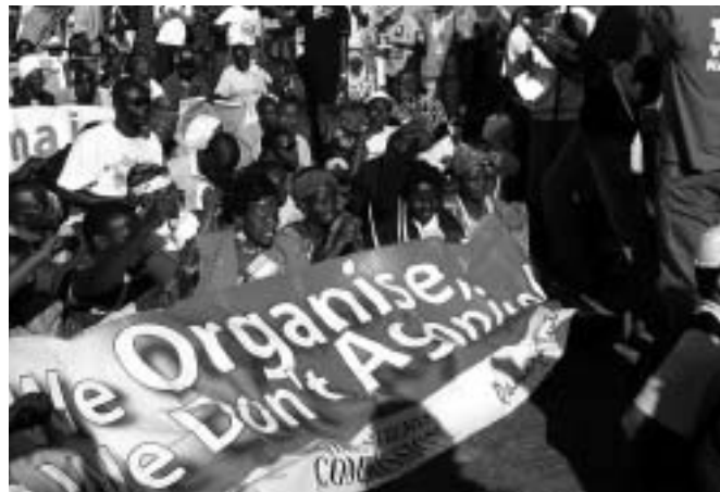
Nairobi, "We organise, we don't agonise" - FCONGD

La noció de canvi organitzacional proequitat es presenta