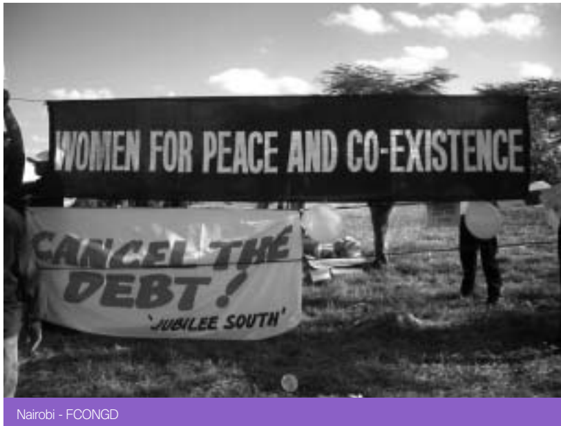
Nairobi - FCONGD

Les ONGD i les agències del desenvolupament en general, “ràpidament passen de parlar del gènere, que és una relació social, a referir-se al benestar de les dones, deixant així els homes –i implícitament les relacions desiguals de poder- fora de l’anàlisi”