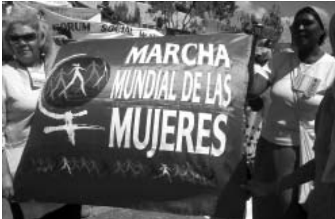
Nairobi - FCONGD

tirà en les prioritats del nou Pla director de cooperació 2007-2010.