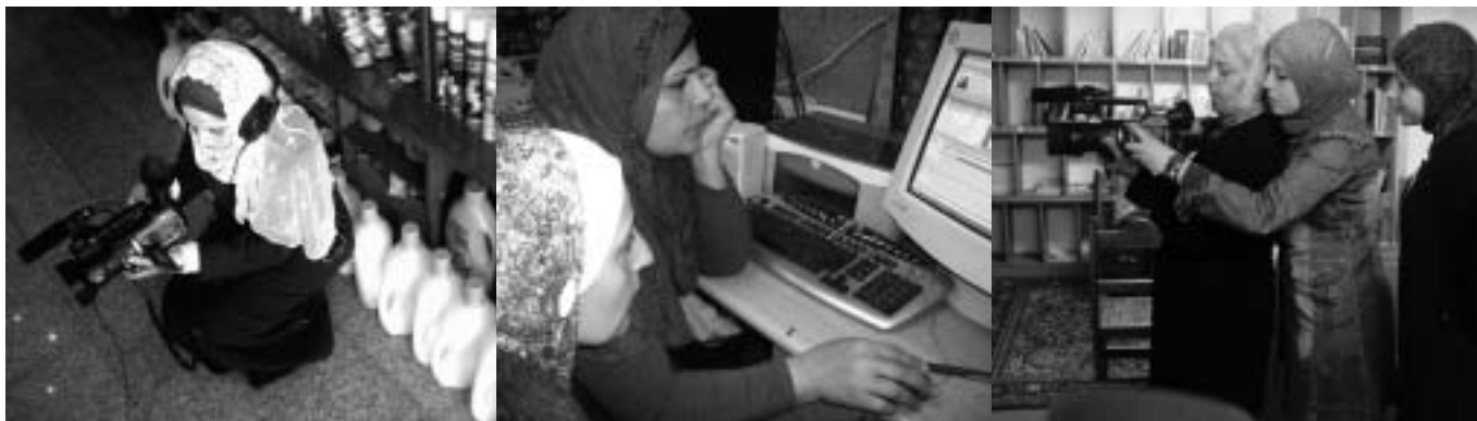
Tallers de formació - Women Media & Development

sagren aquesta imatge, i encara en major mesura. La mostren sempre com una víctima de la violència política, i no la veiem sinó plorant els màrtirs, gemegant per la destrucció de les seves cases, fent albórbols (crits de dol)... i cada imatge capgira la realitat del moment. No s'entra en detalls ni es respecta el dret individual durant les gravacions, al periodista se li permet la intrusió sense preocupar-se pels sentiments i sense disculpar-se, i a sobre es vanen de tot això com si ells mateixos estiguessin mostrant la part més gran del sofriment polític.