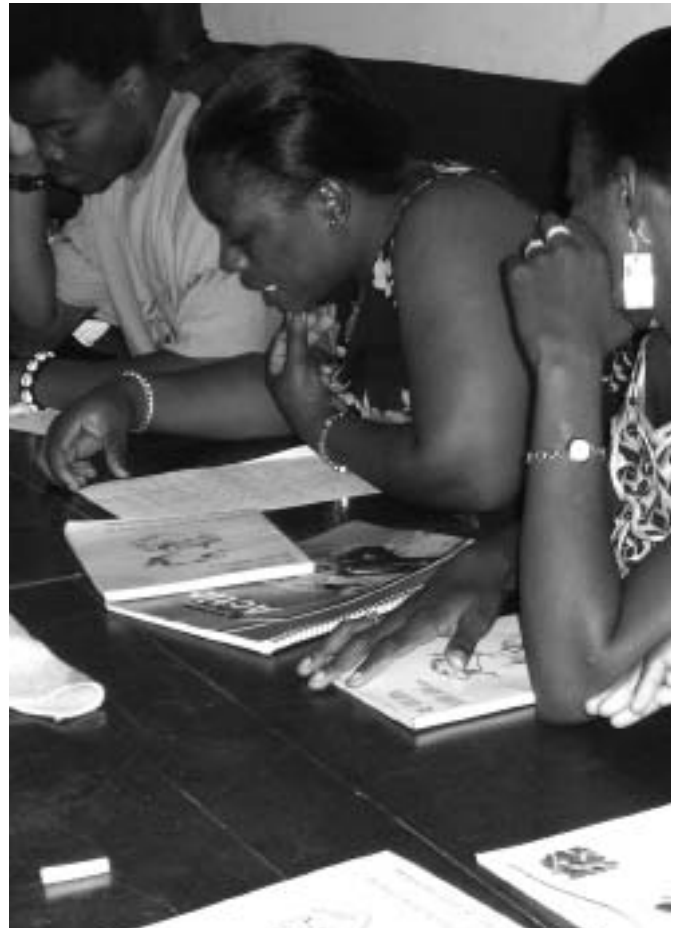
Alfabetització de dones a Guinea - InteRed

Sí, ja que ha determinat la identificació de noves contraparts expertes en temes de gènere i la introducció de programes i projectes de capacitació en gènere en aquelles contraparts que fins aleshores no havien abordat en directe el gènere. InteRed ha realitzat tallers de formació en gènere per a les contraparts, s'han promogut passanties de personal de les contraparts, entre les que ja tenien una llarga experiència de treball i altres que s'iniciaven en la temàtica.