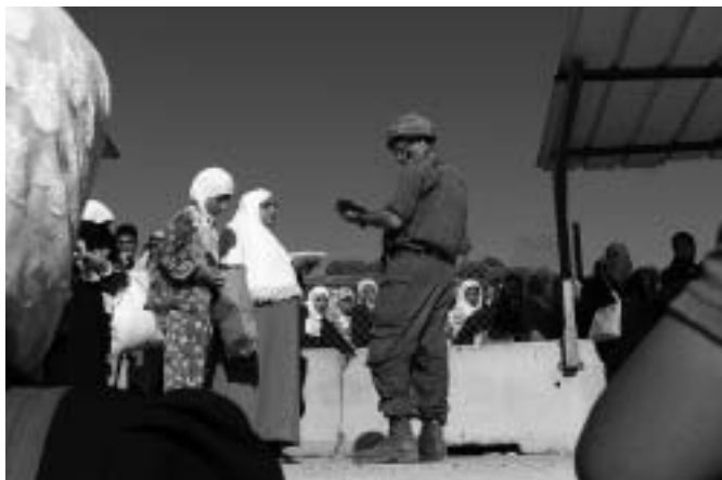
Control a Palestina - Associació pels Drets Humans a Afganistan (ASHDA)

ceint. De fet, segueixen intentant reocupar Bagdad. Això suposa el bombardeig, els trets a l'atzar, les detencions, i pentinar els carrers i les cases una a una, més matances i destrucció, en nom de la lluita contra un terrorisme que ha estat creat per la pròpia ocupació. El bombardeig de ciutats està prohibit pel dret internacional, però les tropes americanes, que prescindeixen de la legalitat vigent, no volen tenir baixes. La protecció dels soldats ocupants és la seva primera prioritat, bombardegen des de molt amunt.