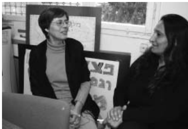
Imatge de l'entrevista - Assemblea de Cooperació per a la Pau

Lily: El conflicte d'aquí és polític, no es tracta d'una cosa “natural”: està causat pels polítics. Jueus i àrabs van viure molt bé durant molts anys.