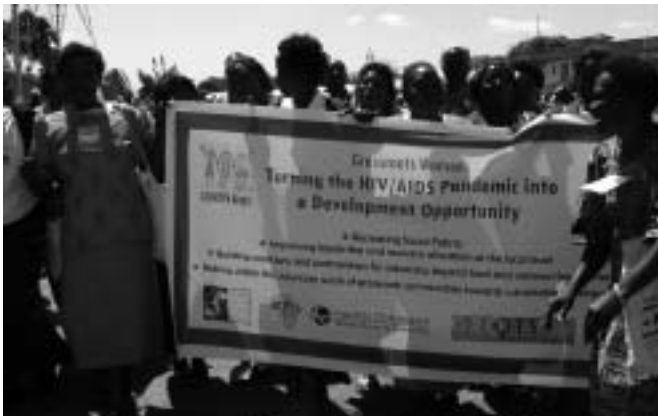
Nairobi - FCONGD

la SIDA és la Informació, Educació i Comunicació (IEC) per generar un canvi d'actitud en la població, fins i tot en els nens i les nenes. Ara ja s'està parlant de la SIDA a les escoles, com a mínim perquè aquests infants estiguin informats i, a més, puguin parlar amb els seus pares i les seves mares i provocar un canvi d'actitud en les famílies.